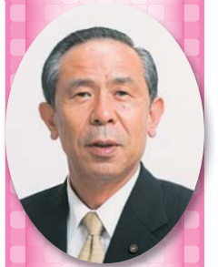
関西たばこ国民健康保険組合